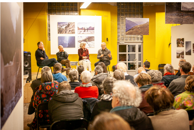
Café-climat santé et environnement